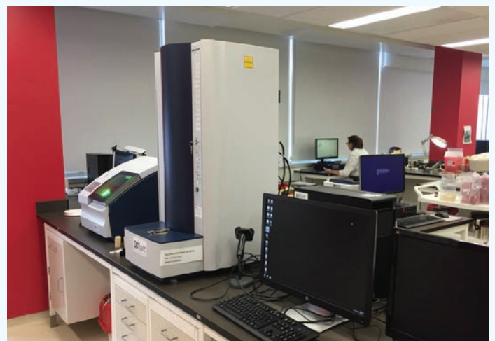
Équipement servant à l'analyse MALDI-TOF d'échantillons de lait.

Si vous voyez des noms de micro-organismes inconnus sur vos rapports de mammite, demandez à votre médecin vétérinaire ou au laboratoire de diagnostic de vous fournir plus d'information sur ces espèces.